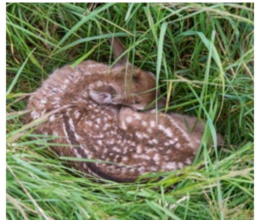
Abliegende Kitze dürfen nicht angefasst werden.

Rehe dürften viele Kinder schon mal gesehen haben. Der Unterricht kann daher an deren Erfahrungen aus Wildgehe-