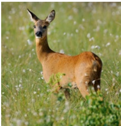
Eine Ricke mit rotbrauner Sommerdecke.

Damit es die mageren Zeiten, wenn im Winter die grüne Pflanzenäsung knapp wird, gut übersteht, muss sich ein Reh im Herbst eine dicke Feistschicht (Speck) als Reserve anlegen. Wichtig ist zudem, dass es sich energiesparend, also ungestört ruhig, verhalten kann. Bleibt die Schneedecke lange geschlossen, sorgen Jäger und Forstleute dafür, dass Rehe zusätzliches Futter bekommen.