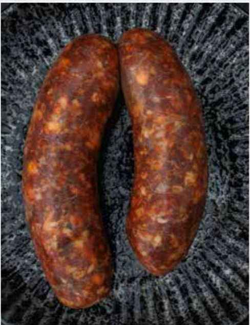
Die spanische Paprikawurst ist einfach herzustellen und saulecker.

miteinander vermengen. Nicht zu kräftig mengen, damit das Fett in kleinen Stücken erhalten bleibt. Das Brät in die Därme füllen und Würste von rund 10 cm Länge abdrehen. Die fertige Wurst etwa 2 h kühl abhängen lassen, dann kann sie vakuumiert oder zubereitet werden.