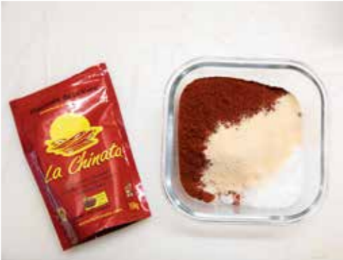
Das spanische Paprikapulver Pimentón de la Vera sorgt für Farbe und Geschmack.