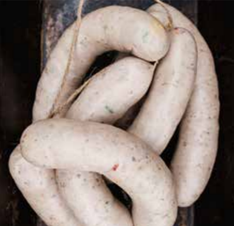
Da in Bratwurst kein Nitritpökelsalz kommt, findet beim Brühen keine Umrötung statt.

Nun in etwa 80 °C heißem Wasser für 30 Min. brühen. Dann kurz in kaltem Wasser abschrecken und anschließend aufhängen. Sobald die Wurst abgetrocknet ist, kann sie gegrillt oder vakuumiert werden.