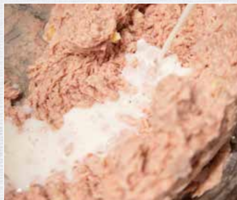
Ein kräftiger Schuss Milch verfeinert das wilde Wurstbrät.

Das Fleisch in Würfel schneiden. Die ganze Zitrone in Würfel schneiden und mit dem Wildfleisch durch die feine Lochscheibe (3 mm) wölfen. Nun im Kutter unter Zugabe der Gewürzmischung, gewürfelten Zwiebeln,