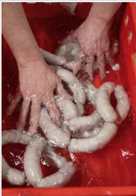
Nach dem Brühen werden die Würste in eiskaltem Wasser abgeschreckt.

W ürste lassen sich nach der Art der Herstellung grob in drei Kategorien einteilen: Rohwürste, Brühwürste und Kochwürste. Bei Rohwürsten wird das Wildfleisch roh verarbeitet und anschließend an der Luft getrocknet und/oder kalt, warm oder heiß geräuchert. Das Kalträuchern erfolgt bei Temperaturen von 15 bis etwa 25 °C bei einer Luftfeuchtigkeit von 75 bis 80 %. Diese Methode dauert am längsten. Beim Warmräuchern liegt die Temperatur zwischen 30 bis 50 °C. Übliche Temperaturen fürs Heißräuchern sind 70 bis zu 120 °C.