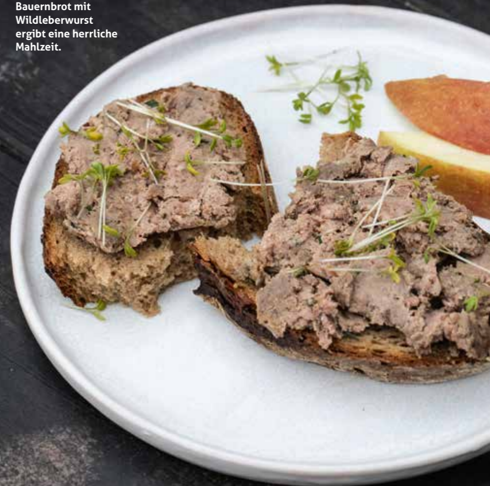
Eine dicke Scheibe Bauernbrot mit Wildleberwurst ergibt eine herrliche Mahlzeit.