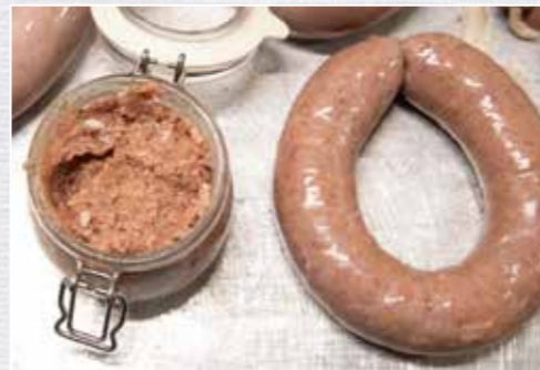
Das Brät in Därme füllen – überschüssiges Brät in Einmachgläsern einkochen.