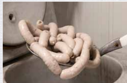
Nach dem Brühen werden die Würste in eiskaltem Wasser abgeschreckt.

ziehen lassen. Anschließend in eiskaltem Wasser für 1 bis 2 Min. abschrecken. Die fertige Weißwurst noch kurz abhängen lassen, dann kann sie vakuumiert werden.