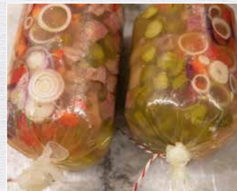
Nach dem Befüllen der Kunststoffdärme muss die Sülze auskühlen, um fest zu werden.

Gemüse geben, mit der Brühe aufgießen, straff abbinden und abkühlen lassen. Dabei immer wieder drehen, um eine gleichmäßige Verteilung des Inhalts zu gewährleisten. Nach etwa 30 Min. wird die Sülze allmählich fest, schnittfest ist sie jedoch erst nach 12 h Kühlzeit.