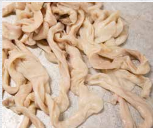
Robuste Rinderkranzdärme eignen sich hervorragend für Koch- und Rohwürste.