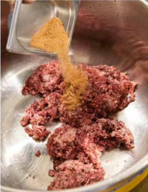
Das gemischte Wildhack wird mit der fertigen Gewürzmischung vermengt.