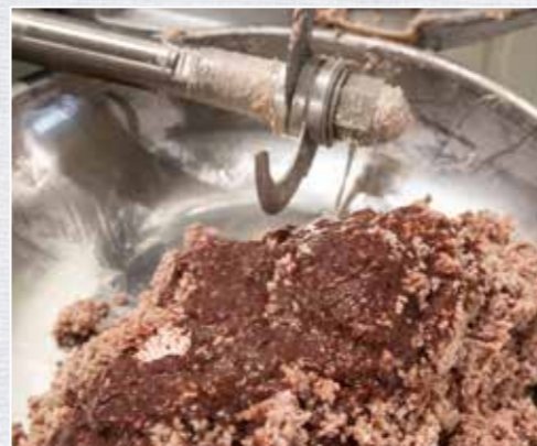
Die Hirschleber wird roh gewolft und mit dem gebrühten Brät im Kutter vermischt.

Das Fleisch abschöpfen und abtropfen lassen, mit der Leber mischen und direkt durch die feine Lochscheibe (3 mm) drehen. Gewürzmischung und Meersalz abwiegen und untermischen. Damit die Masse sämig wird, zudem noch etwas Brühwasser zufügen, circa 0,5 bis 0,7 l. Die gesamte Masse gründlich vermengen. Gegebenenfalls weiteres Brühwasser untermischen. Rinderkranzdärme wässern, das Wasser mehrmals wechseln. Anschließend mit dem Brät gleichmäßig befüllen, eindrehen und direkt abbinden oder mit einem Clip verschließen. Nun die Leberwurst erneut in 75 °C heißem, leicht gesalzenem Wasser für 30 Min. ziehen lassen. Anschließend in eiskaltem Wasser kurz abschrecken. Die Wurst kann nun aufgehängt vollständig auskühlen und später verzehrt werden. Für den besonderen Pfiff unserer Variante: Die Leberwurst für etwa 8 h kalt räuchern.