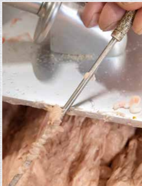
Beim Kutteln sollte immer wieder die Temperatur des Bräts überprüft werden.