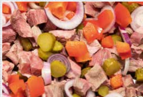
Unsere Einlage für die Sülze kommt wild, säuerlich und herzhaft daher.

Wildbret pökeln, dafür zunächst eine 13-prozentige Pökellake herstellen. Dazu Wasser aufkochen und auf 1 l Wasser 150 g Nitritpökelsalz mischen. Die Lake abkühlen lassen und mit einer Pökelspritze in das Fleisch spritzen, bis es gesättigt ist. Im Anschluss das gepökelte Wildbret vakuumieren und bei 80 °C für 30 Min. garen.