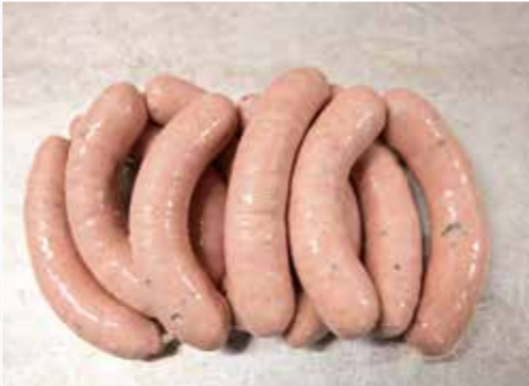
Nach dem Kuttern wird das Brät in Därme gefüllt und in gleichmäßigen Abständen abgedreht.

Gewürzmischung sowie portionsweise das zerstoßene Eis dazugeben. Das Brät sollte beim Kuttern eine Temperatur von 12 °C nicht überschreiten. Zuletzt noch Käse, Schinken, Peperoni und Spinat unterheben (nicht kuttern, die Einlage soll ihre Form behalten). Die Därme wässern, mit dem Brät gleichmäßig befüllen und in gleichen Abständen (etwa 14 cm) eindrehen.