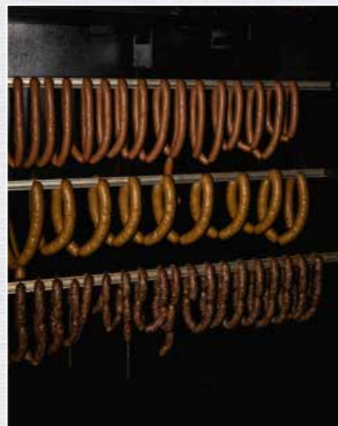
Einige Wurstsorten werden geräuchert, andere gebrüht und wieder andere durchlaufen beide Prozesse.

Durch das Garen in 80 °C heißem Wasser wird die Wurst haltbar und schnittfest.