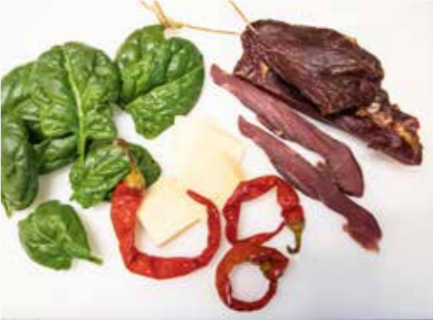
Spinat, Peperoni, herzhafter Käse und rauchiger Wildschinken bilden die Einlage.

Zubereitung Wildbret in Würfel schneiden, Gewürzmischung abwiegen und vermengen. Schinken und Käse in feine Würfel schneiden, Peperoni entkernen und mit dem Spinat fein hacken. Nun im Kutter oder einer geeigneten Küchenmaschine das Wildfleisch zu einem feinen Brät verarbeiten. Von Beginn an die