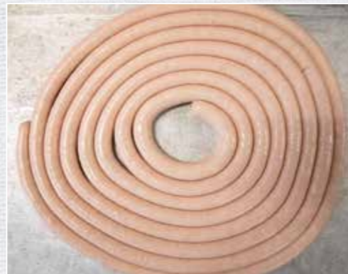
Alles hat ein Ende, nur die wilde Wiener Wurst hat zwei.

befüllen und in gleichen Abständen (circa 20 cm) eindrehen. Die Würste aufhängen und etwa 45 Min. trocknen lassen. Anschließend etwa 1,5 h heiß räuchern, bis sie eine Kerntemperatur von 72 °C erreicht haben. Sie sollten Farbe haben, aber nicht zu dunkel werden. Dann ohne abzukühlen in