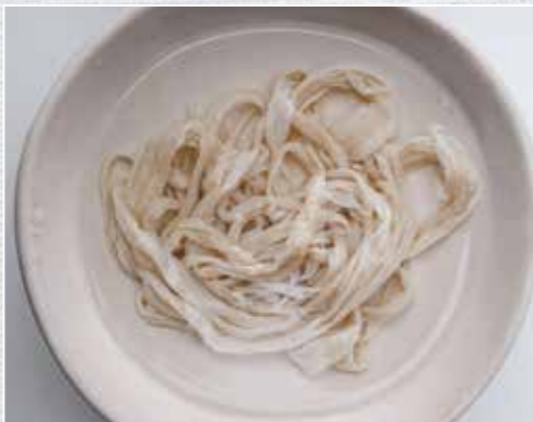
Das Brät wird in zarte Schafsaitlinge gefüllt, diese garantieren den besonderen Biss.

Wildbret würfeln, durch die feine Lochscheibe (3 mm) wölfen und kuttern. Das Brät so lange kuttern, bis es eine Temperatur von 12 °C erreicht hat. Zu Beginn des Kutters die Gewürze und das Eis untermischen. Die Därme wässern, mit dem Brät gleichmäßig