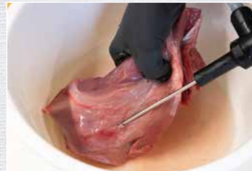
Grundlage für die Sülze bildet das gepökelte und vorgebrühte Wildbret.

Gemüse putzen und klein schneiden. Wildbret nach Ende der Garzeit abkühlen lassen und würfeln. Heiße Gemüsebrühe mit der Gewürzmischung und einem Schuss Essig abschmecken, Aspik nach Packungsanleitung dazugeben (Aspik vermindert das Aroma, sodass im Voraus etwas kräftiger gewürzt werden muss). Nun in die Sterildärme eine Mischung aus Fleisch und