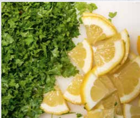
Ein Muss in jeder Weißwurst: frische Petersilie, abgerundet mit Säure der Zitrone.