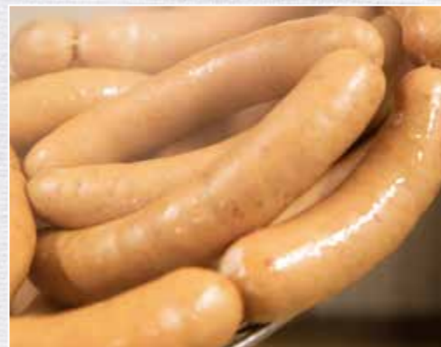
Würzige Wild-Currywurst goldbraun geräuchert und gebrüht – einfach lecker.

Gelegentlich mit einem Kernfühler oder ähnlichen Thermometer die Temperatur ermitteln. Das feine Brät in einen Wurstfüller geben und in gewässerte Därme füllen. In gleichmäßigen Abständen eindrehen und in einem Räucherofen für etwa 1,5 h bei 70 °C heiß räuchern. Nun in einem Wasserbad so lange brühen, bis die Kerntemperatur von 75 °C erreicht ist. Anschließend in kaltem Wasser abschrecken. Zuletzt aufhängen, trocknen und auskühlen lassen. Nun kann die wilde Currywurst vakuumiert und eingefroren oder direkt gegrillt werden.