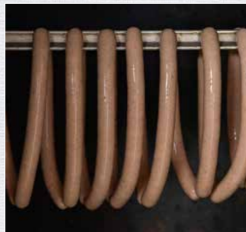
Durch den Rauch bekommt die Wurst ihre charakteristische Farbe und ihr Aroma.

75 °C heißem Wasser für 15 Min. brühen. Hinterher in kaltem Wasser kurz abschrecken. Die Würste sind nun fertig und können nach dem Auskühlen direkt verzehrt werden.