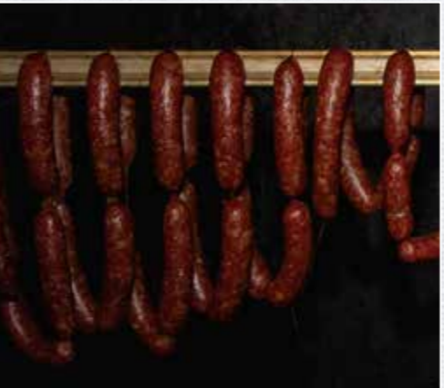
Im Räucherofen röten die Cabanossi um, wodurch ihre charakteristische Farbe entsteht.

Zubereitung Wildbret und Speck würfeln und vermengen. Die Gewürzmischung abwiegen, darüber verteilen und durch die feine Lochscheibe (3 mm) wölfen; nun erneut gründlich vermengen. Das fein gewolfte Brät in einen Wurstfüller geben.