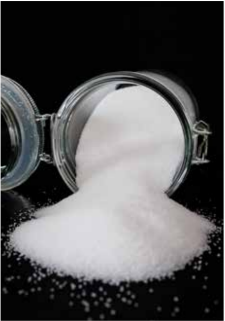
Salz dient der Haltbarmachung und ist gleichzeitig Geschmacksträger.

Natürlich muss nicht zwangsläufig in jede Wurst NPS. Heiß geräucherte und auf anderen Wegen gegarte Waren wie Wiener Würstchen können auch bedenkenlos mit Koch- oder Meersalz