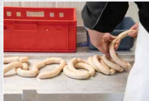
Wildes Wursten – selbst erlegt und handgefertigt schmeckt es immer am besten.

Mageres und fettreiches Fleisch vermengen. Die Gewürze entsprechend des Fleischgewichts abwiegen, darüber verstreuen und durch die feine Lochscheibe (3 mm) des Fleischwolfs drehen. Anschließend in einem Kutter unter Zugabe von zerstoßenem Eis so lange zu einem feinen Brät verarbeiten, bis die Fleischtemperatur 12 °C erreicht.