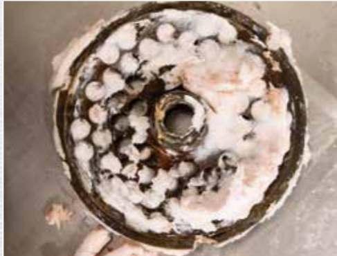
Für die Grobeinlage wird Wildschweinfett halb gefroren durch den Wolf gedreht.

Rückenspeck in daumendicke Streifen schneiden und einfrieren. Den gefrorenen Rückenspeck mit der groben Scheibe (6 mm) wolfen. Das Wildfleisch würfeln und mit der feinen Scheibe (3 mm) wolfen. Salz und Gewürze hinzugeben und alles gründlich