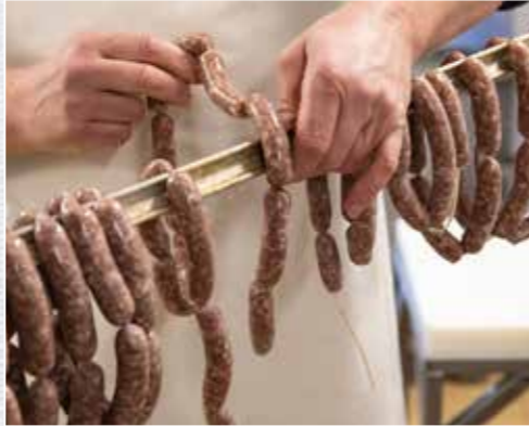
Bevor die kleinen Rohwürste in den Rauch kommen, werden sie zum Trocknen aufgehängt.

Zubereitung Wildbret und Speck würfeln und vermengen. Die Gewürzmischung abwiegen, darüber verteilen und durch die feine Lochscheibe (3 mm) wölfen; nun erneut gründlich vermengen. Das fein gewolfte Brät in einen Wurstfüller geben.