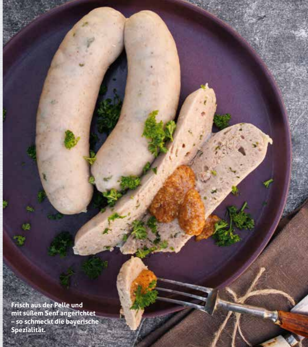
Frisch aus der Pelle und mit süßem Senf angerichtet – so schmeckt die bayerische Spezialität.

ziehen lassen. Anschließend in eiskaltem Wasser für 1 bis 2 Min. abschrecken. Die fertige Weißwurst noch kurz abhängen lassen, dann kann sie vakuumiert werden.