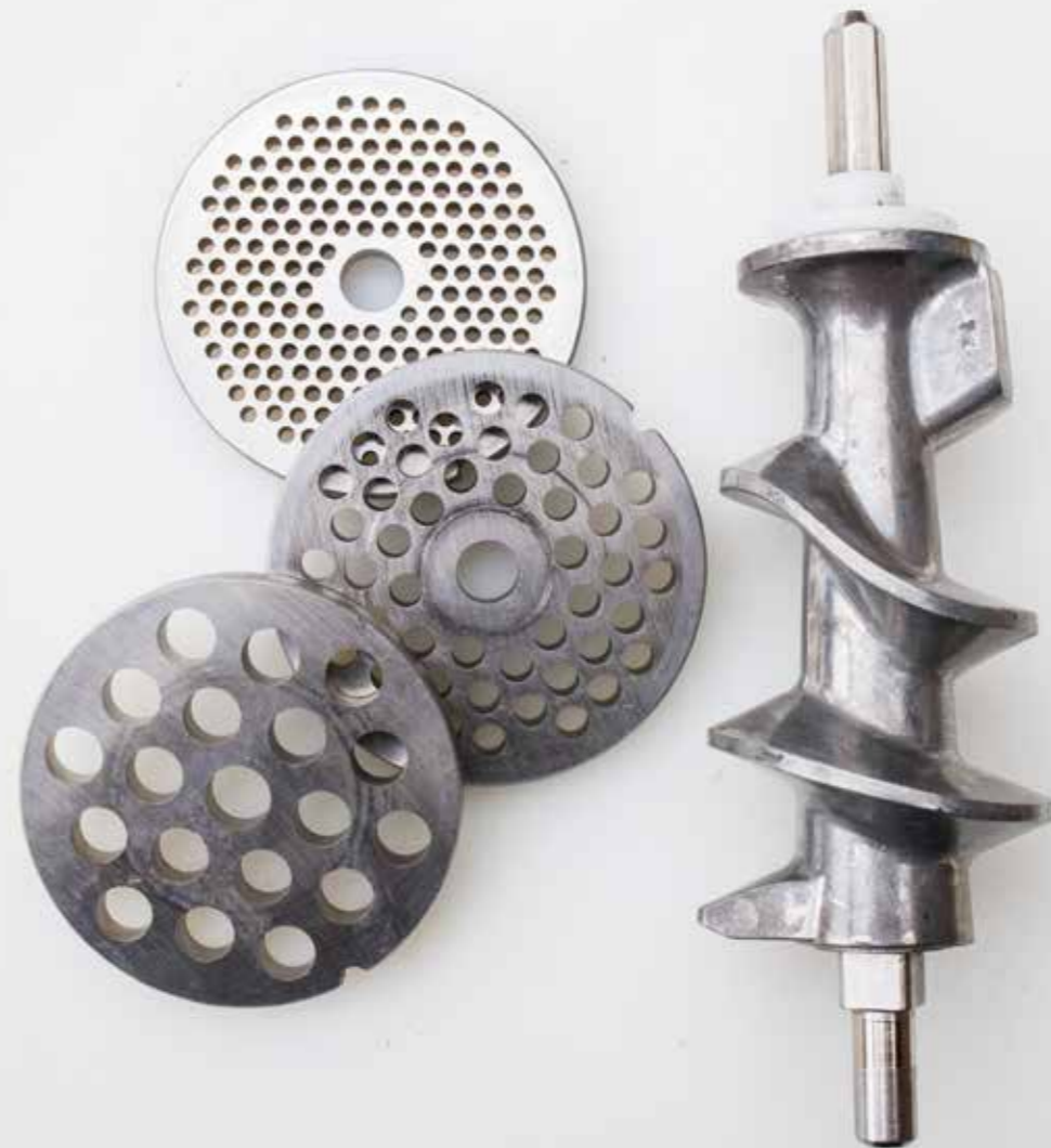
Von grob bis fein – zum Wolfen gibt es unterschiedlich große Lochscheiben.

Für Koch- und Brühwürste braucht es einen Kessel oder großen Kochtopf mit einem Fassungsvermögen von 20 l. Für Räucherwurst wie beispielsweise Wiener Würstchen ist eine Räuchermöglichkeit vonnöten. Infrage kommen selbst gebaute oder gekaufte Räucheröfen, -schränke oder -tonnen. Auch wichtig: Räucherthermometer sowie Räuchermehl oder -späne. Ein elektrischer Kaltrauchgenerator oder ein Sparbrand vereinfachen die Arbeit.