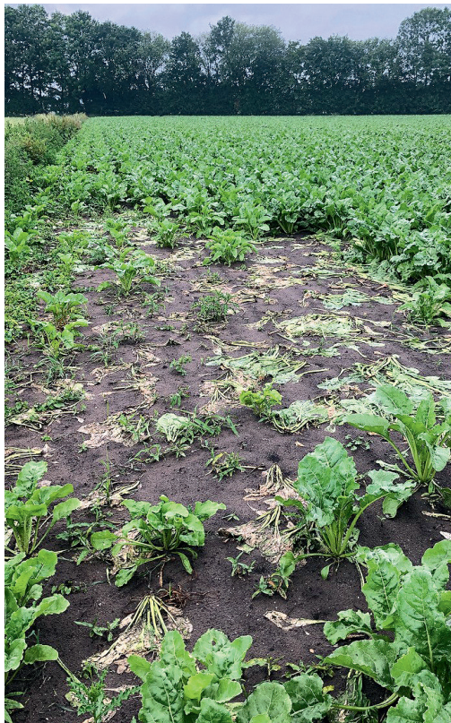
Nutrias richten Fraßschäden an Ufern an, aber auch auf Ackerflächen (hier Rübenfeld).

Als Unterschlupf legen die Tiere mit ihren Familienverbänden in Gewässernähe meterlange Röhrensysteme mit einem Wohnkessel an. Sie fressen Wasserpflanzen und Ackerfrüchte (z. B. Rüben), selten stehen auch Schnecken und Würmer auf dem Speiseplan. Während Biber eher Lebensräume schaffen, verarmt die Ufervegetation, wenn die gefräßigen Nutrias am Werk sind: Brut- und Schutzräume von Vogel- und Fischarten verschwinden, die Uferbereiche verlieren ihre Stabilität. Seit 2016 ist die Nutria auf der EU-Liste der invasiven, gebietsfremden Tierarten aufgeführt und wird bejagt.